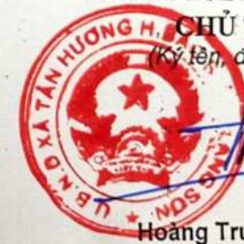
Hoàng Trường Sơn